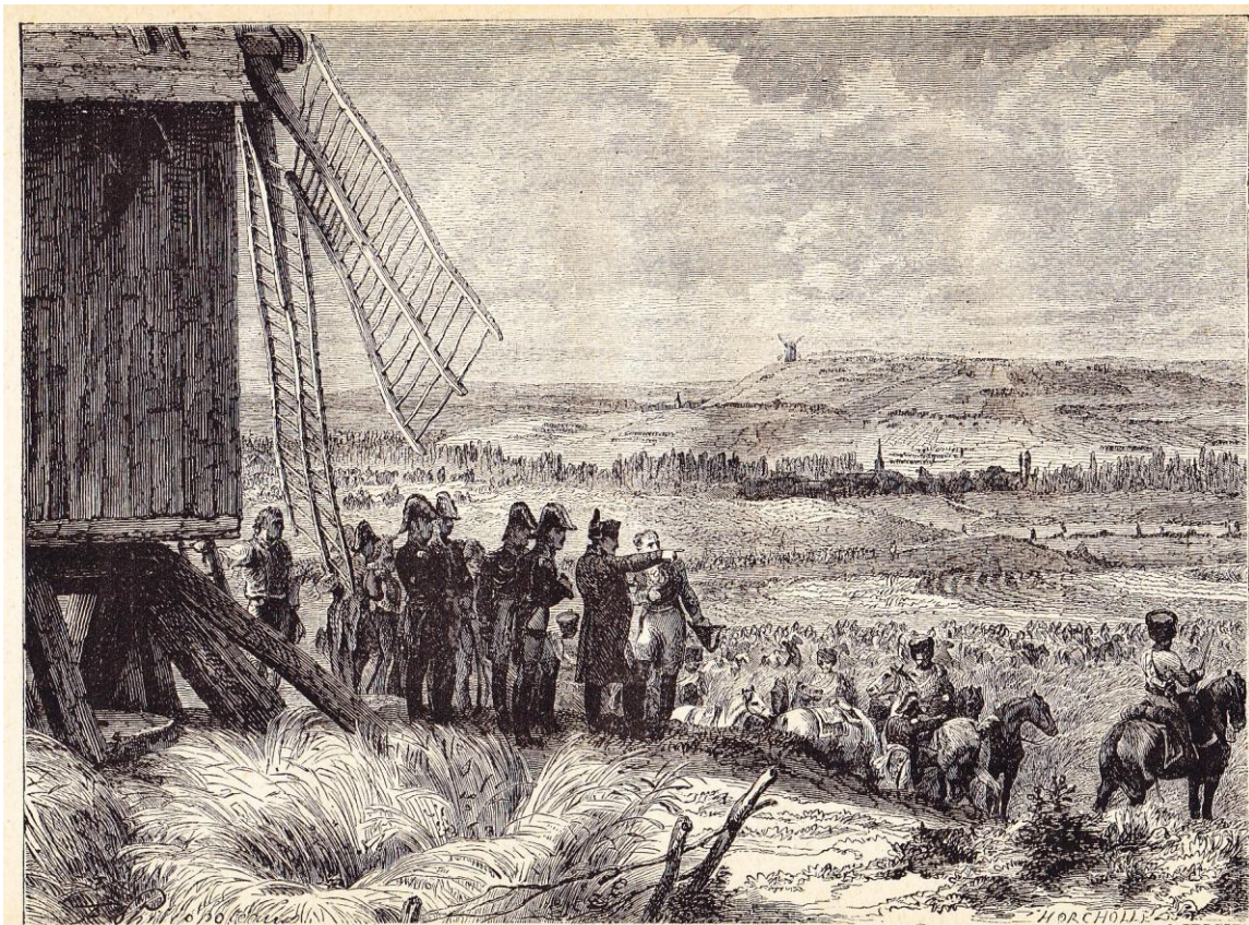
Bataille de Ligny. — Napoléon donnant ses ordres d'attaque.

Il s'agit vraisemblablement du même moulin figurant dans l'illustration suivante gravée d'après Félix Philippoteaux (1815-1884) : https://data.bnf.fr/fr/11919593/felix_philippoteaux/